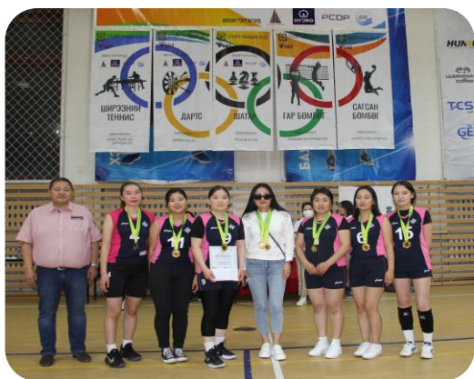
1-р байр "ББСМО" ХХК

Зохион байгуулагч "МОНХИДРО КОНСТРАКШН" ХХК / гар бөмбөг /-ийн "ШИЛДЭГ ТОГЛОГЧ"-дыг тодруулж, мөнгөн шагналаар шагналаа.