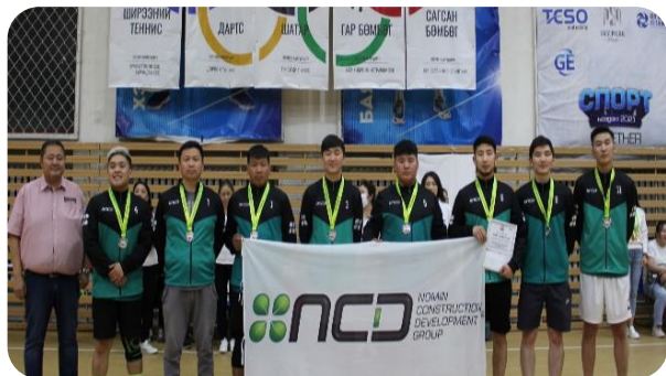
2-р байр "NCD групп" ХХК