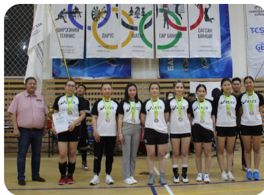
2-р байр "Монхидро констракшн" ХХК