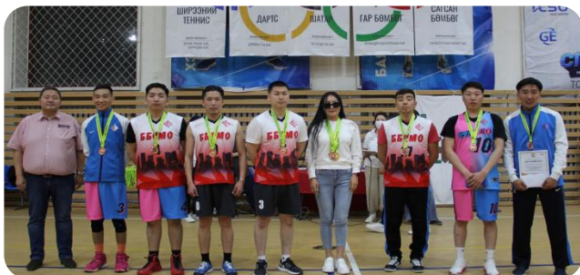
3-р байр "ББСМО" ХХК